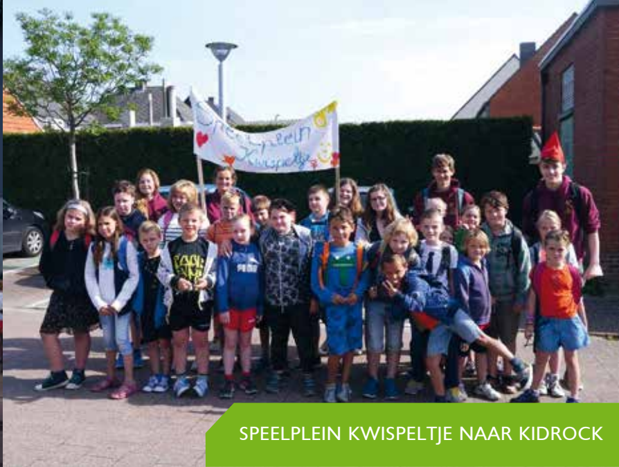
SPEELPLEIN KWISPELTJE NAAR KIDROCK