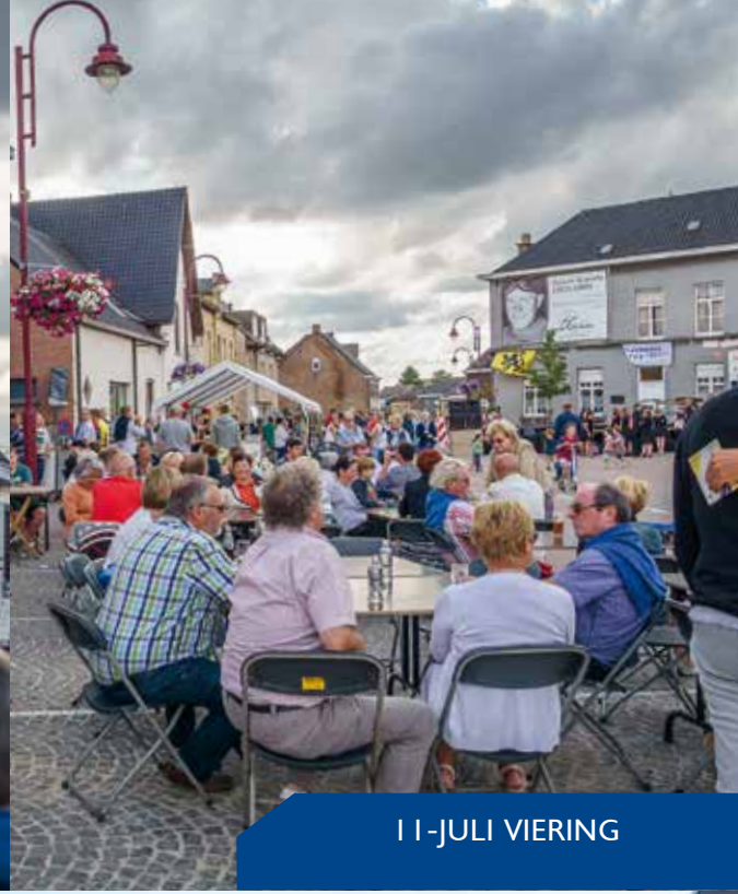
11 JULI VIERING